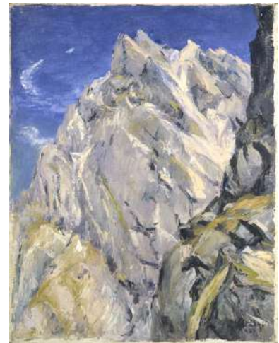
足立源一郎《滝谷の岩壁》1951（昭和26）年

足立源一郎 《滝谷の岩壁》 1951（昭和26）年 古茂田守介 《コンポジション》 1950（昭和25）年頃 広幡憲 《コンポジション》 1935（昭和10）年頃