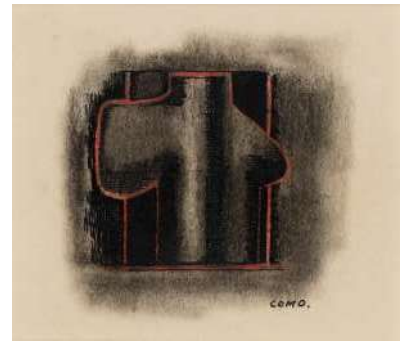
古茂田守介《コンポジション》1950（昭和25）年頃