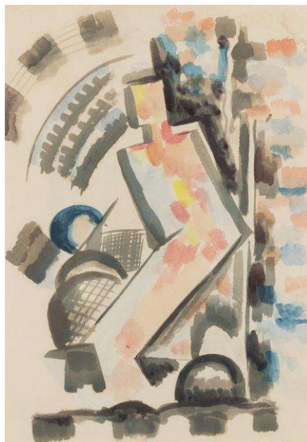
③広幡憲《コンポジション》1935（昭和10）年頃