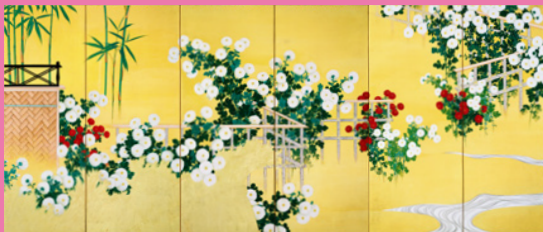
《国之華》 大正13年(1924) 紙本金地着色 皇居三の丸尚蔵館 【前期】特別出品