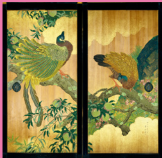
《桃に青鳥圖》 昭和3年(1928) 板着色 オーストラリア大使館