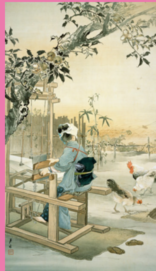
《秋晴(秋色)》 明治40年(1907) 絹本着色 北野美術館 【前期】