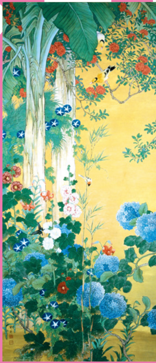
《四季花鳥(言)》 大正7年(1918) 紙本着色/四幅対のうち 当館【後期】