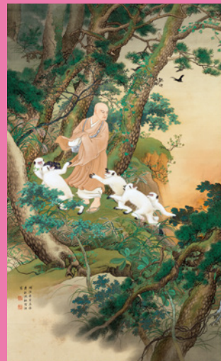
《日蓮上人遊難之図》 明治44年(1911) 絹本着色 一般財団法人 北方文化博物館

生誕150年にあたり、秀畝の人生と代表作をたどり、画歴の検証を行うとともに、あらたなる視点で旧派と呼ばれた画家にスポットを当てるものです。本展では、特別出品として昭和天皇(皇太子当時)の婚礼祝いに皇室に献上された「国之華」を展示します。