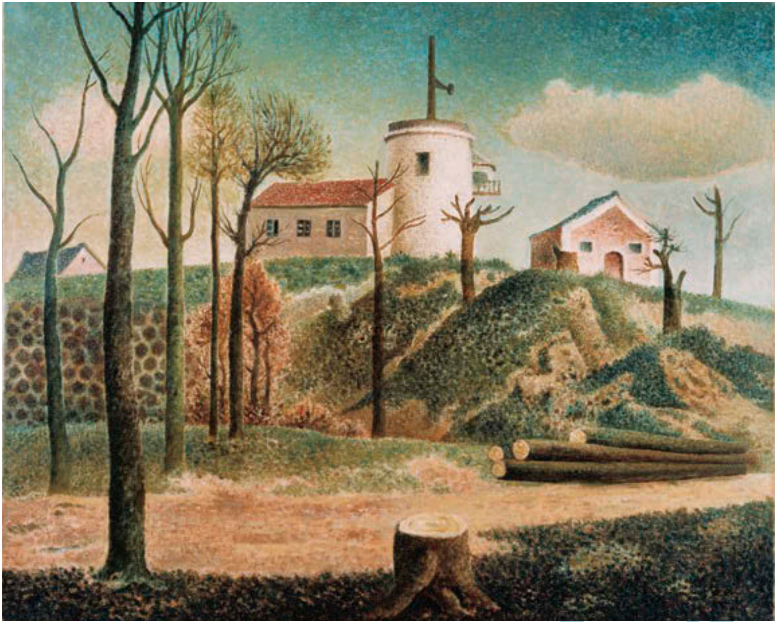
岡鹿之助《観測所》1951年 静岡県立美術館