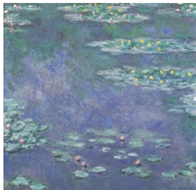
③クロード・モネ《睡蓮》1907年 アサヒビール大山崎山荘美術館蔵