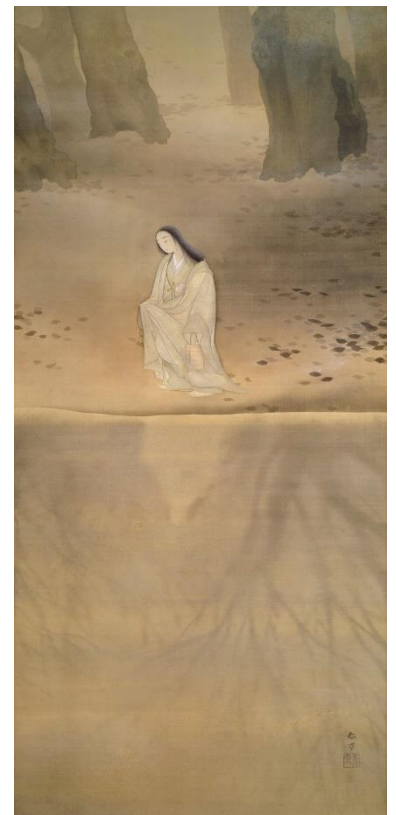
④菱田春草《伏姫（常磐津）》1900年 長野県立美術館蔵