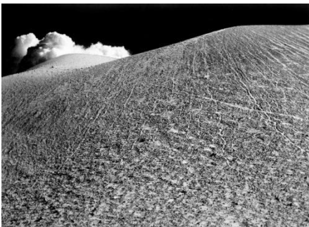
②田淵行男《初冬の浅間 黒斑山の中腹より》1940年 田淵行男記念館蔵