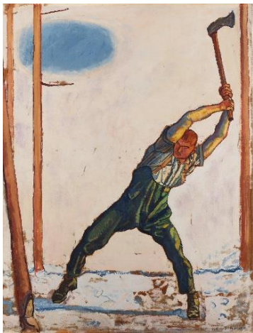
①フェルディナント・ホドラー《木を伐る人》1910年 大原美術館蔵