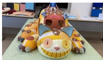
▼⑥ネコバス 1/5 スケール模型