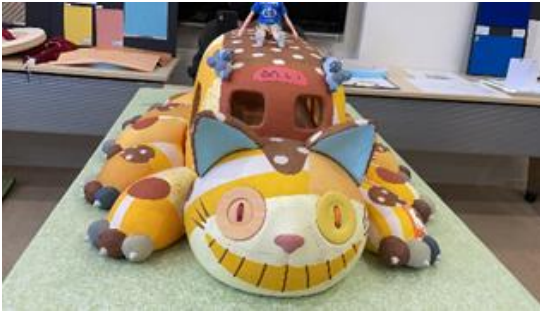
ネコバス 1/5 スケール模型