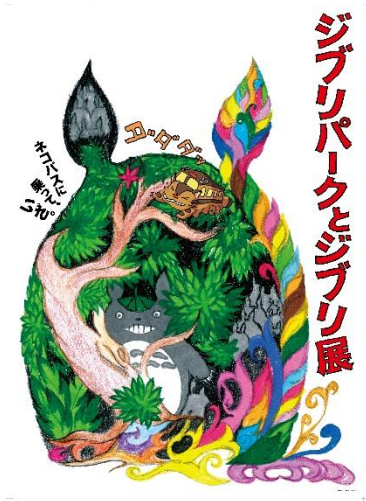
▼①ポスタービジュアル