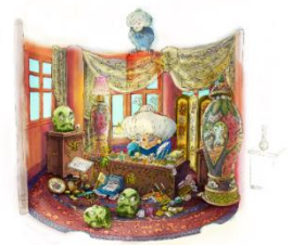
▼③「にせの館長室」の制作イメージ図