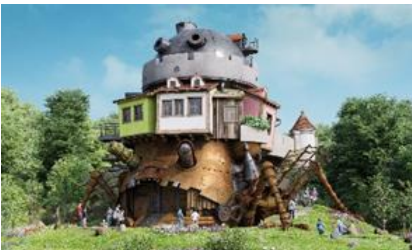
「ハウルの城」のCGパース