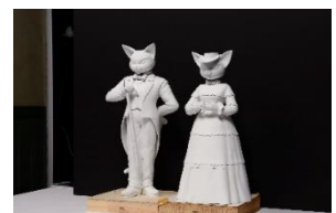
▼⑦パロンとルイーゼの検討模型