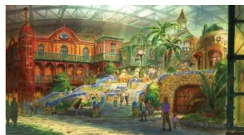
▼⑤ジブリの大倉庫イメージスケッチ