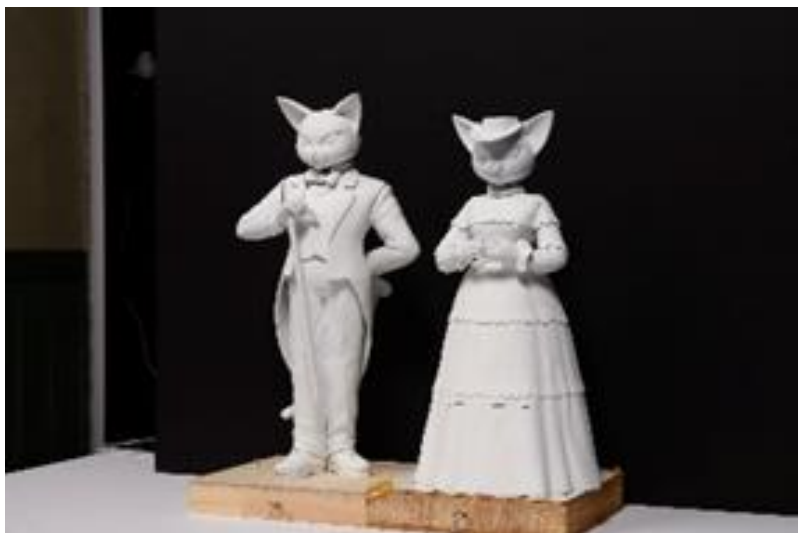
バロンとルイーゼの検討模型