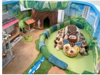
「ネコバスルーム」の室内模型内観