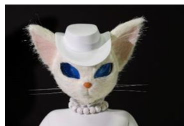
バロンとルイーゼの頭部検証用模型