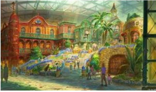
ジブリの大倉庫 イメージスケッチ 宮崎吾朗画