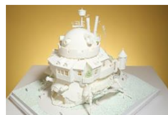
「ハウルの城」1/50 模型 3号機