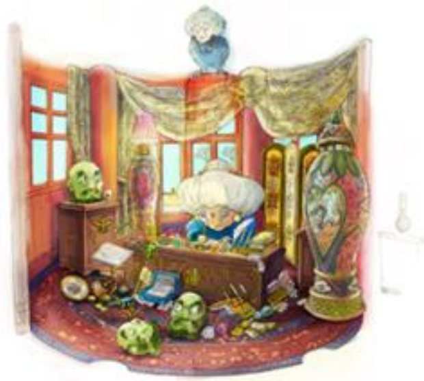
「にせの館長室」の制作イメージ図