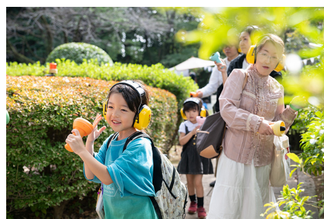
《Touch the sound picnic》2017年、アクチュエータ、アンプ、マイク