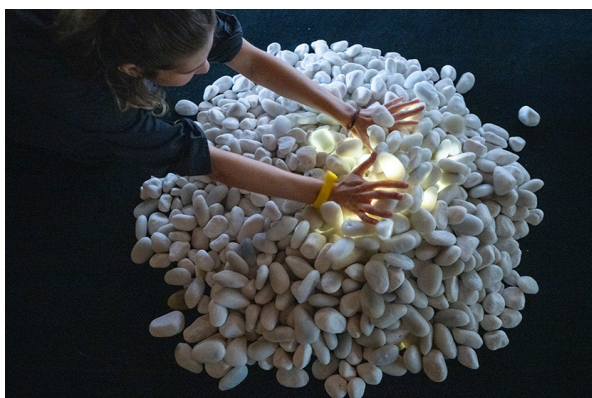
《the blink stone》2013年、樹脂、センサー、太陽電池、基板、 共同制作: 首藤 圭介

長野県立美術館本館2階の「アートラボ」は、視覚以外の感覚も使った鑑賞が可能な「ラボラトリー(実験室)」となることを目指しています。触れて、見て、感じて、アートラボで自分の感覚を再発見し、それをだれかと共有する鑑賞の楽しさに出会ってみませんか。