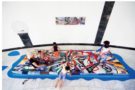
安部泰輔《太郎の恋》展示風景、2010年、広島市現代美術館蔵。

安部は会場にミシンを持ち込み、会期中毎日ひたすら作品を作り続けるスタイルで、全国各地の美術館やギャラリー、アートプロジェクト等で活動しつづけてきました。今回の公開制作では、オープンギャラリーを拠点に、当館のコレクションに着想を得た作品や、美術館の周辺地域とのつながりを意識した作品を制作し、美術館内外に展開していきます。公開制作に先駆けて制作された《誕生仏》は、当館が収蔵する村山槐多の絵画《尿する裸僧》に着想を得ながら、現代美術の祖とも呼ばれるマルセル・デュシャンの代表作《泉》とそれを撮影したアルフレッド・スティューグリッツの写真、さらには国宝の《誕生釈迦立像》(東大寺)など、様々な要素が安部のインスピレーションによって合わさり生まれました。会期中にどんな作品が飛び出すか、その過程も含めてご注目ください。