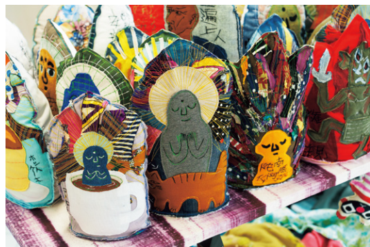
安部泰輔「黄金森」展示風景、黄金町バザール2024。