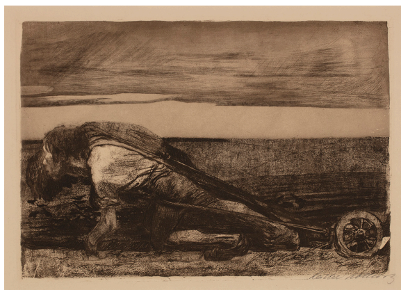
ケーテ・コルヴィッツ《鋤を引く人（『農民戦争』第1葉）》1906年（ひとミュージアム上野誠版画館コレクション）