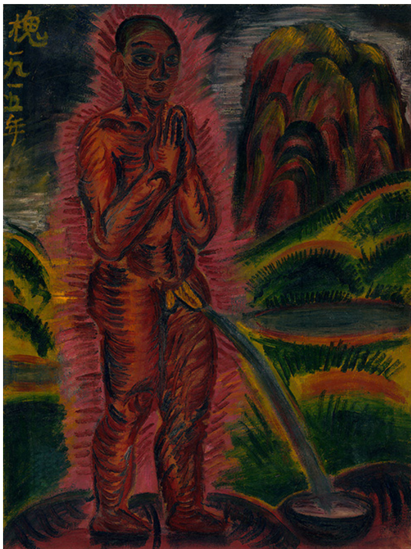
村山槐多《尿する裸僧》1915年（信濃デッサン館コレクション）

長野県にゆかりのある作家たちや、信州の風景が描かれた作品を中心に形成された長野県立美術館のコレクションから、一年を通して、洋画、日本画、工芸等さまざまなジャンルの収蔵品を展示します。