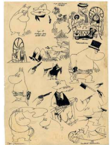
新聞連載マンガ 「タイムマシンでワイルドウエスト」キャラクターズスケッチ 1957年頃 インク、紙 ムーミンキャラクターズコレクション © Moomin Characters™