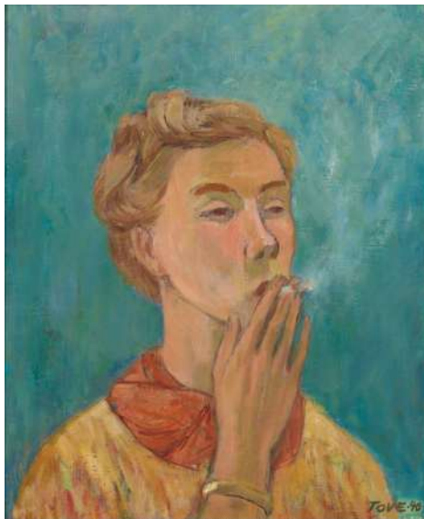
「煙草を吸う娘（自画像）」1940年 油彩、カンヴァス 個人蔵 © Tove Jansson Estate

本展では、トーベの絵画作品を始め、これまであまり知られていなかった壁画制作も紹介します。