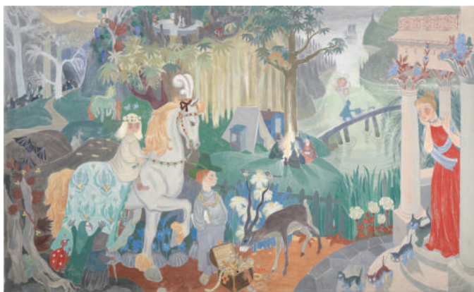
「フェアリーテイル・パノラマ」 1949年 フレスコ・セッコ フィンランド・コトカ市 © Moomin Characters™