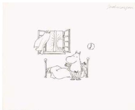
「おはよう」 制作年不詳 インク、紙 ムーミンキャラクターズコレクション