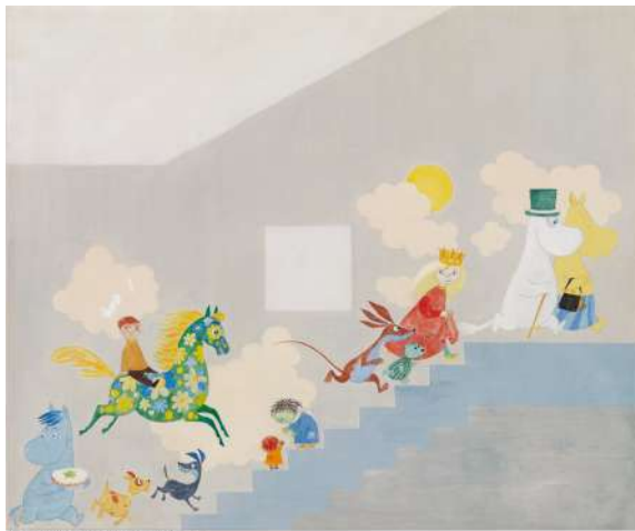
「遊び2 (アウロラ病院小児病棟の壁画のためのコンペティション用スケッチ)」 1955年 テンペラ、カンヴァス ヘルシンキ市立美術館 © Moomin Characters™