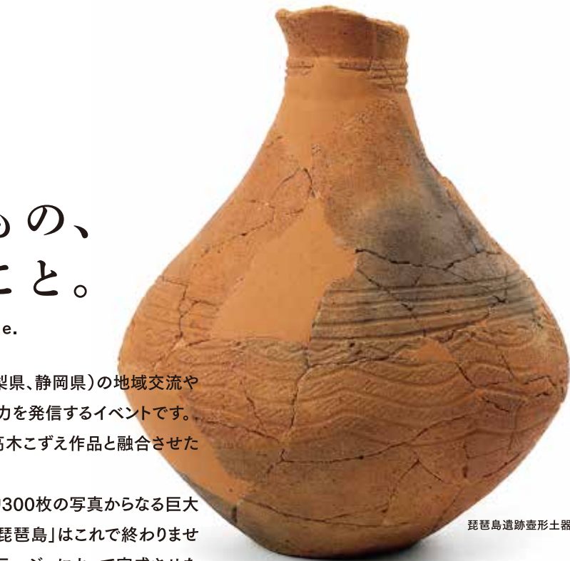
琵琶島遺跡壺形土器