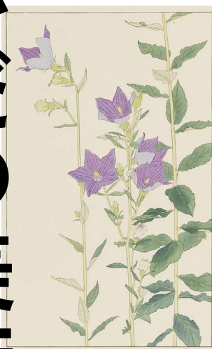
杉浦非水(ききやう(桔梗))「[非水百花譜]第12幅より」 1931年 長野県立美術館蔵