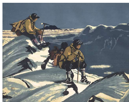
山口進 (木曾駒ヶ岳馬の背) 1963年 長野県立美術館蔵