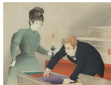
富岡永洗(幽霊塔前) (黒岩浜香(幽霊塔前)扶桑堂、口絵)1901年 長野県立美術館蔵

長野県立美術館には一般来館者のための駐車場はございません。併設の東山魁夷館北側の駐車場は、大型バス、障がいのある方など信州パーキング・パーミット制度にて指定の専用駐車場です。公共交通機関のご利用を推奨いたします。