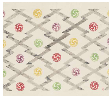
江崎孝坪(松波巴文(風呂敷原画))制作年不詳 長野県立美術館蔵