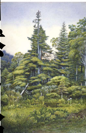
丸山曉露(山上の湿地)制作年不詳 長野県立美術館蔵