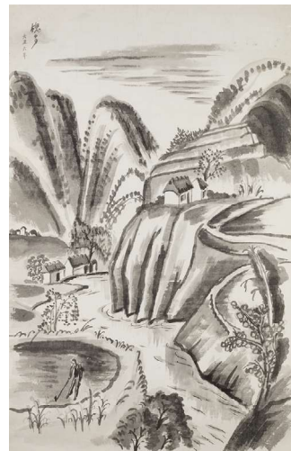
村山槐多(信州風景)1917年 長野県立美術館蔵(信濃デッサン館コレクション)