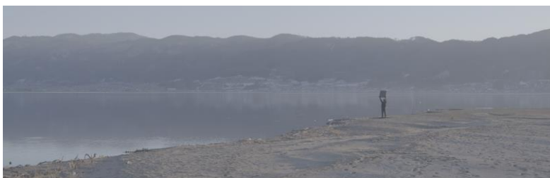
⑤原田裕規《湖に見せる絵（海辺の僧侶）》2022年（特別出品）