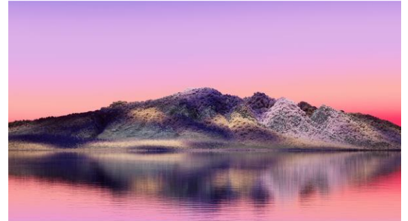
②原田裕規《ホーム・ポート》2023年