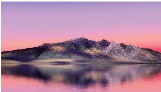
原田裕規《ホーム・ポート》2023年

※諸般の事情により予定に変更が生じる場合があります。最新情報は当館HPをご覧ください。